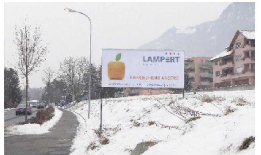
«Erfrischend anders»: Das erste Sujet der neuen Plakatkampagne der Lampert Druckzentrum AG.

Bereits im Vorfeld der Zertifizierung für klimaneutrales Drucken hat sich die Lampert Druckzentrum AG